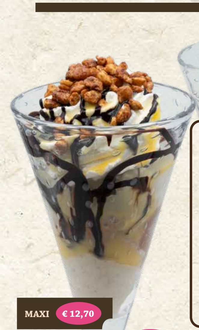
MAXI € 12,70 AUTUNNO Vanille-, Schoko- u. Nusseis*, Sahne*, Eierlikör*, Schokosoße "Bortolot", gebr. Haselnüsse* "Bortolot", Keks* € 9,00