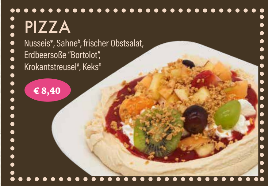
PIZZA Nusseis*, Sahne*, frischer Obstsalat, Erdbeersoße "Bortolot", Krokantstreusel*, Keks* € 8,40