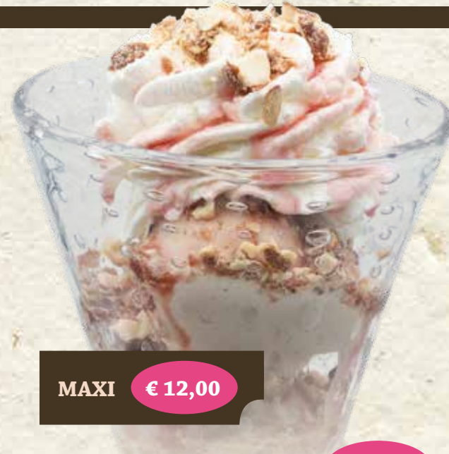
MAXI € 12,00 KROKANT € 8,30 Gem. Milcheis*, Sahne*, Krokantstreusel* "Bortolot", Cherry Brandy, Keks*