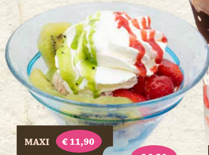
MAXI € 11,90 ITALIA Gem. Eis*, Sahne*, frische Erdbeeren, frische Kiwi, Erdbeersoße "Bortolot", Kiwisoße*, Keks* € 8,20