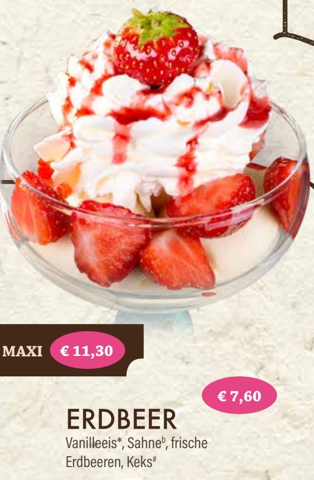
MAXI € 11,30 ERDBEER Vanilleis*, Sahne*, frische Erdbeeren, Keks* € 7,60