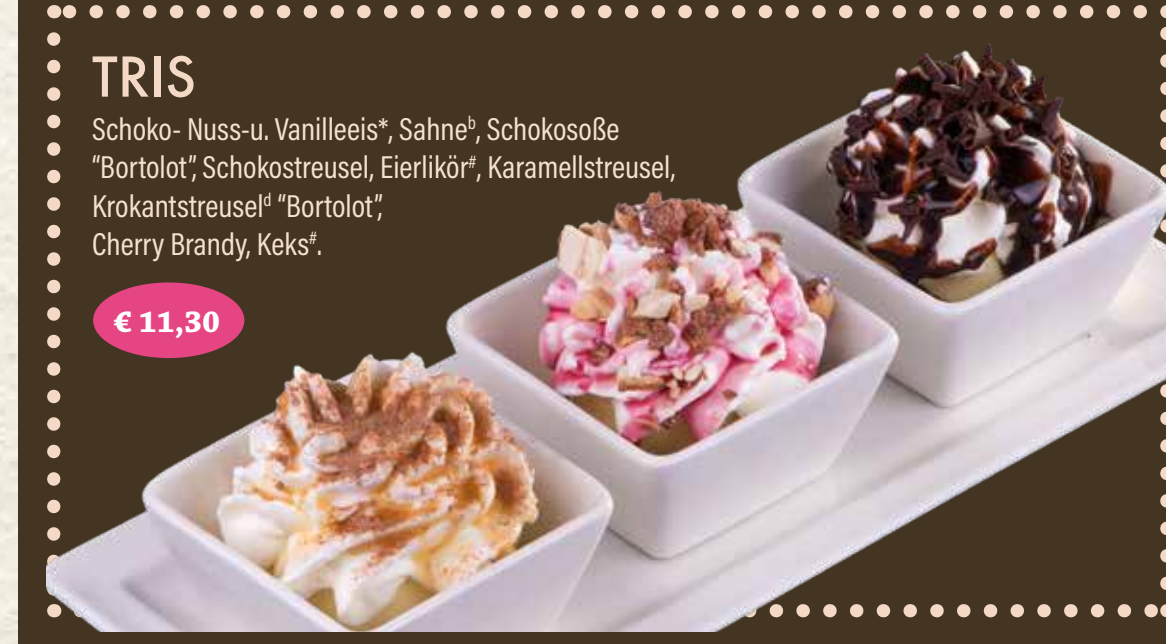
€ 11,30 TRIS Schoko- u. Vanilleis*, Sahne*, Schokosoße "Bortolot", Schokostreusel, Eierlikör*, Karamelstreusel, Krokantstreusel* "Bortolot", Cherry Brandy, Keks*.