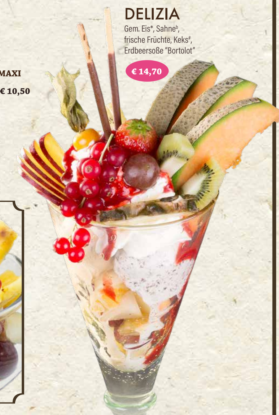
DELIZIA Gem. Eis*, Sahne*, frische Früchte, Keks*, Erdbeersoße "Bortolot" € 14,70