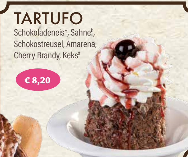
€ 8,20 TARTUFO Schokoladeneis*, Sahne*, Schokostreusel, Amarena, Cherry Brandy, Keks*