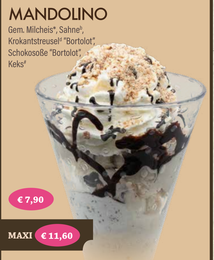
MANDOLINO Gem. Milcheis*, Sahne*, Krokantstreusel* "Bortolot", Schokosoße "Bortolot", Keks* € 7,90 MAXI € 11,60