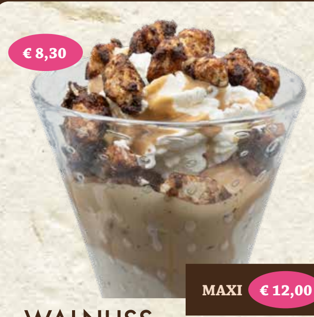
€ 8,30 WALNUSS MAXI € 12,00 Walnusseis*, Sahne*, Walnusslikör* "Bortolot", gebr. Walnüsse* "Bortolot", Keks*