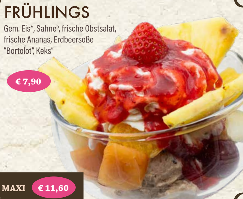
FRÜHLINGS Gem. Eis*, Sahne*, frische Obstsalat, frische Ananas, Erdbeersoße "Bortolot", Keks* € 7,90 MAXI € 11,60