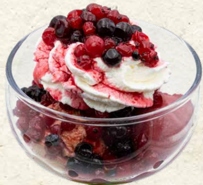
ALPENROSE Gem. Eis*, Sahne*, Waldfrüchte, Keks* € 7,70