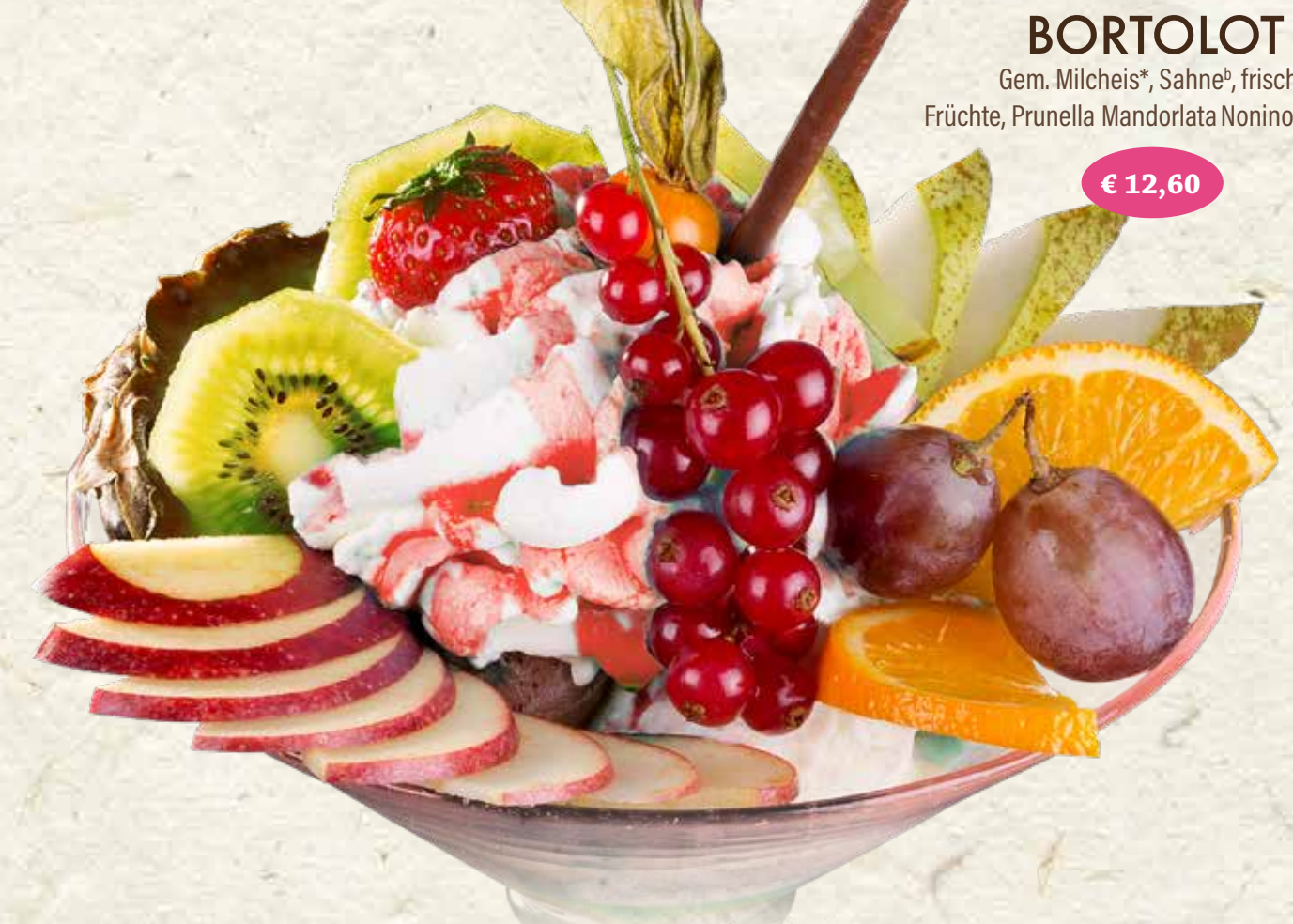
BORTOLOTT Gem. Milcheis*, Sahne*, frische Früchte, Prunella Mandorlata Nonino, Mikado* € 12,60