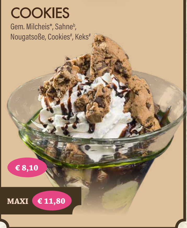
COOKIES Gem. Milcheis*, Sahne*, Nougatsoße, Cookies*, Keks* € 8,10 MAXI € 11,80