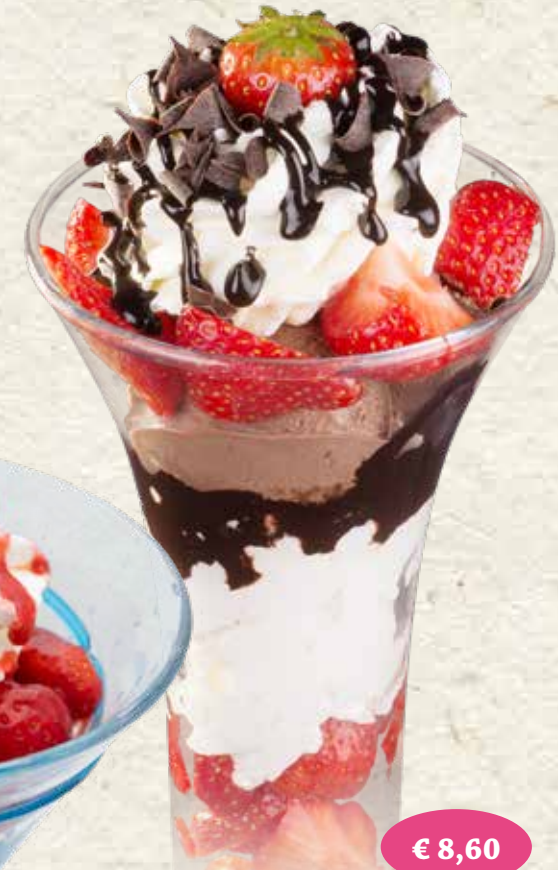
€ 8,60 DUETTO Vanille- u. Schokoladeneis*, Sahne, frische Erdbeeren, Schokosoße "Bortolot", Schokostreusel, Keks*