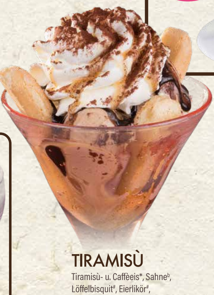
€ 9,20 TIRAMISÜ Tiramisu- u. Caffèeis*, Sahne*, Löffelbiskuit*, Eierlikör*, Schokosoße "Bortolot", Kaffee, Kakaopulver