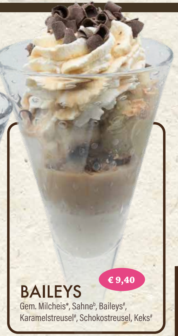
€ 9,40 BAILEYS Gem. Milcheis*, Sahne*, Baileys*, Karamelstreusel*, Schokostreusel, Keks*