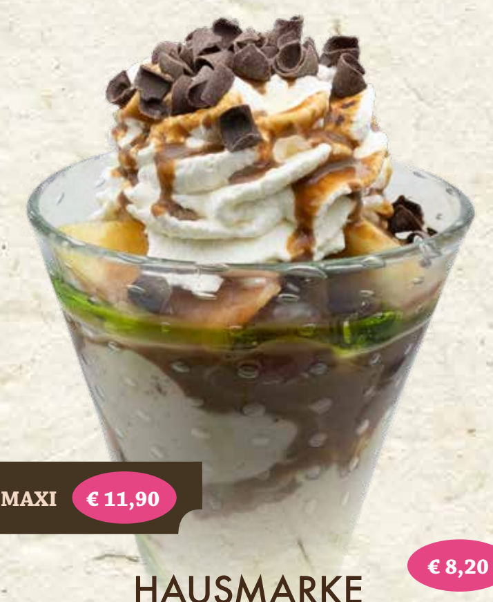
MAXI € 11,90 HAUSMARKE Gem. Milcheis*, Sahne*, frischer Obstsalat, Mokkalikör*, Schokostreusel, Keks* € 8,20