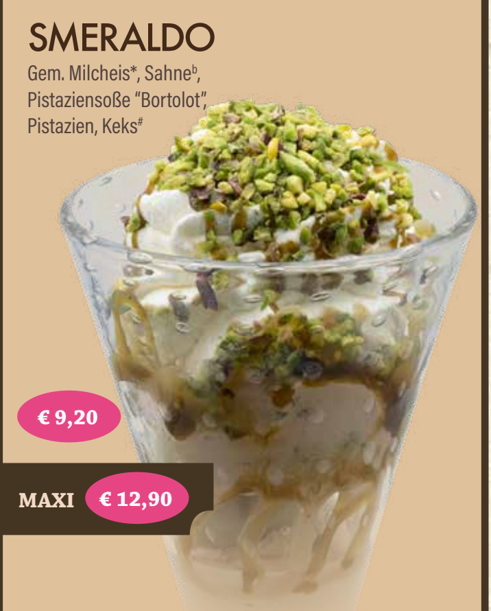
SMERALDO Gem. Milcheis*, Sahne*, Pistaziensoße "Bortolot", Pistazien, Keks* € 9,20 MAXI € 12,90